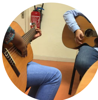
Les jeunes de l'école LAO Musik