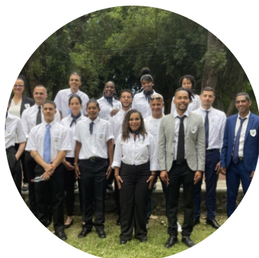
Les jeunes en insertion de l'Académie des Dalons