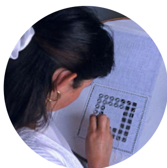
Les artisanes de la Maison de la Broderie