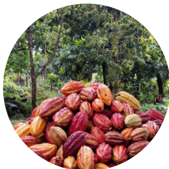
Des agriculteurs engagés