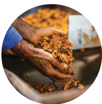
Les cultivateurs de la Maison du curcuma

Le projet Romans Lao est destiné à un public varié et éclectique, il proposera des rencontres intergénérationnelles afin de toucher les petits et les grands et valorisera les habitants et le savoir-faire des territoires du grand Sud de La Réunion.