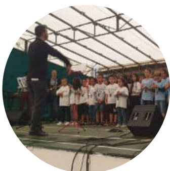
Les élèves des écoles primaires