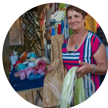
Les tresseuses de Choca et Vacoa