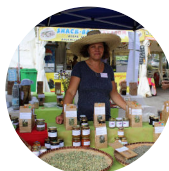
Les tisaneuses du Jardin du Piton Bétoume