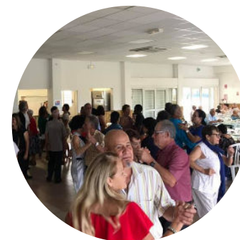
Les clubs & associations