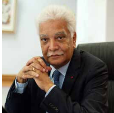
Jean Claude de L'Estrac quand il était Secrétaire général de la COI de 2012 à 2016.

Au cours d'une conversation téléphonique, Jean Claude de L'Estrac m'a parlé de son nouveau livre. J'ai compris tout de suite que « La chanson inachevée » se distingue de ses autres livres.