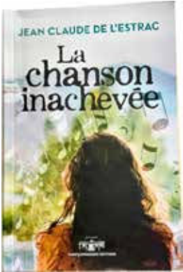
« La chanson inachevée », Jean Claude de L'Estrac, Pamplemousses Editions, 2024.

Jean Claude de L'Estrac est une figure majeure de la République de Maurice. Ancien journaliste et directeur de presse, il a été plusieurs fois ministre. Il est l'auteur de plusieurs livres, dont « Passions politiques », « Mauriciens, enfants de mille combats » et « Le Pacte brisé ». Il a été élevé par la France au rang d'officier de la Légion d'Honneur en 2011.