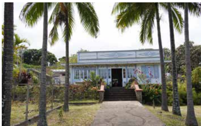
La belle maison familiale où se tient le marché de Noël, les 14 & 15 décembre.

Les marchés de Noël, en cette période de l'année, ce n'est pas ce qui manque, ici comme ailleurs. Toutefois, c'est la première fois qu'il y a un marché de Noël aux Avirons, les 14 et 15 décembre. Si proximité et authenticité sont les deux principales cartes qui caractérisent ce projet, inédit dans cette commune dynamique, où l'Académie a désormais ses bureaux, plusieurs autres éléments font la singularité de cette manifestation.