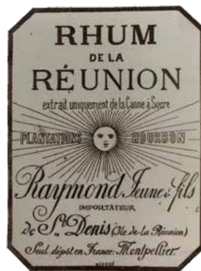
Moniteur de La Réunion, 1869.

Les indices typologiques de ce gobelet semblent indiquer la recherche de qualités ergonomiques (le tenir bien en main) et esthétiques (le décor personnalisé). Pour toutes ces raisons il peut être identifié comme un « verre à rhum ». Il pourrait s'agir d'une commande des distillateurs réunionnais qui choisissent de se distinguer des autres îles sucrières comme Maurice, Mayotte ou les Antilles