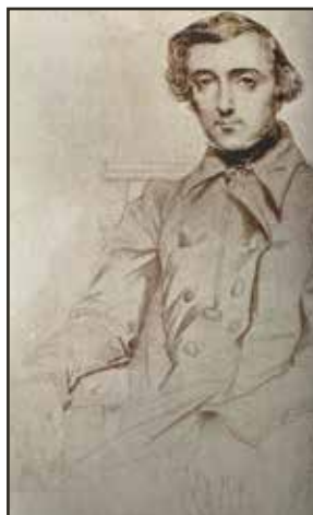
Portrait d'Alexis de Tocqueville par son ami le peintre Théodore Chassériau, in, Le Point H.S., Alexis de Tocqueville. La passion de la liberté , mai-juin 2018, p. 4.

• Le rejet de l'ordre établi. La loi étant la même pour tous, il est logique, tous soient « également admissibles à toutes les dignités, places et emplois publics, (...) sans autre distinction que celle de