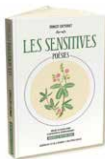
« Les Sensitives » d'Ernest Cotteret - édition 2024.

À l'approche du 20 décembre, « fête réunionnaise de la liberté », l'Académie de l'île de La Réunion, en partenariat avec ARS – Terres Créoles, propose à la délectation des amoureux de la poésie une nouvelle édition du recueil « Les Sensitives » de Ernest Cotteret. Recueil publié en 1862.