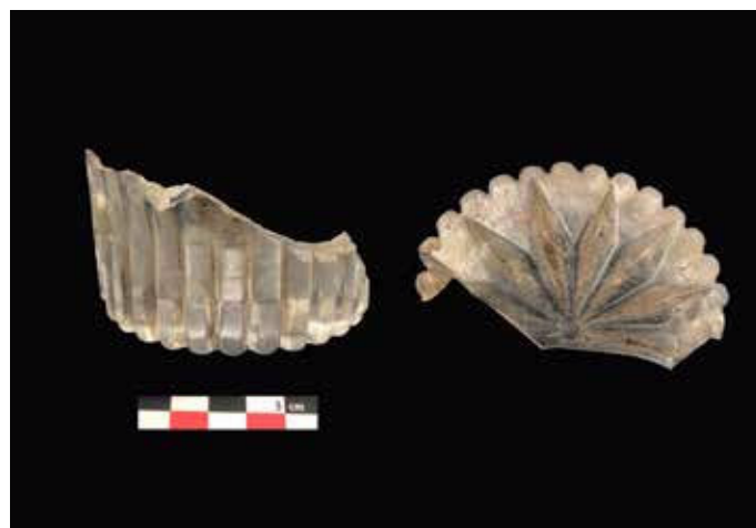
Verre à rhum, Saint-Paul Entrée Est Lot 3, n° 974/2018 - 881/114 - 0085

On retrouve ce gobelet dans les corpus de magasins portuaires,